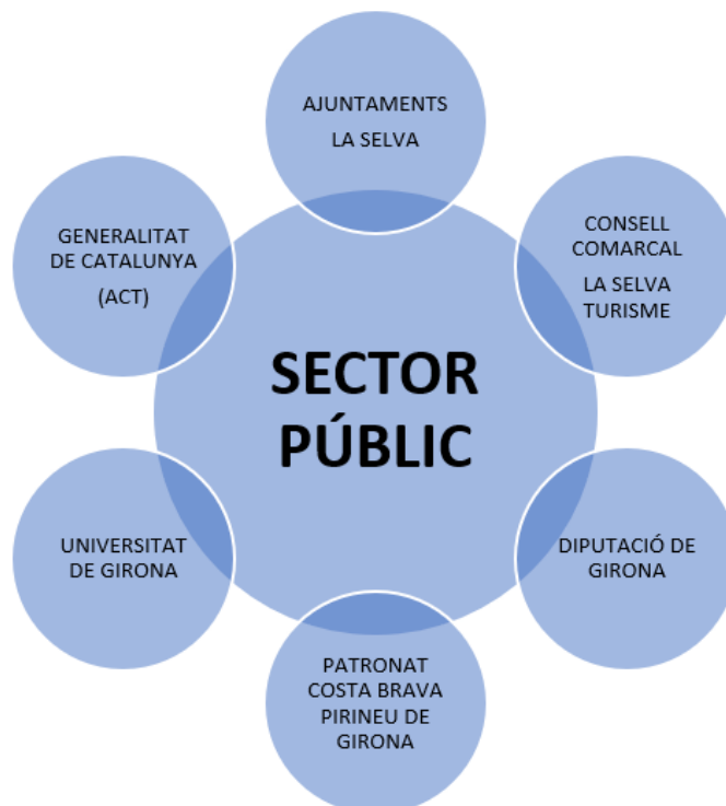
Gràfic 3: Conjuntura sector públic

En l'àmbit autonòmic, la Generalitat de Catalunya a través de l'Agència Catalana de Turisme (ACT) es proposa formar part d'ella mitjançant la marca turística ja creada de Cicloturisme. D'aquesta manera es realitza una promoció a l'exterior i, per tant, la participació a fires estatals i internacionals així com la participació en l'organització de famtrips i l'oportunitat a mitjà-llarg termini d'obrir nous mercats als ja identificats com a tradicionals (alemany, belga, holandès, anglès i procedents del nord d'Europa).