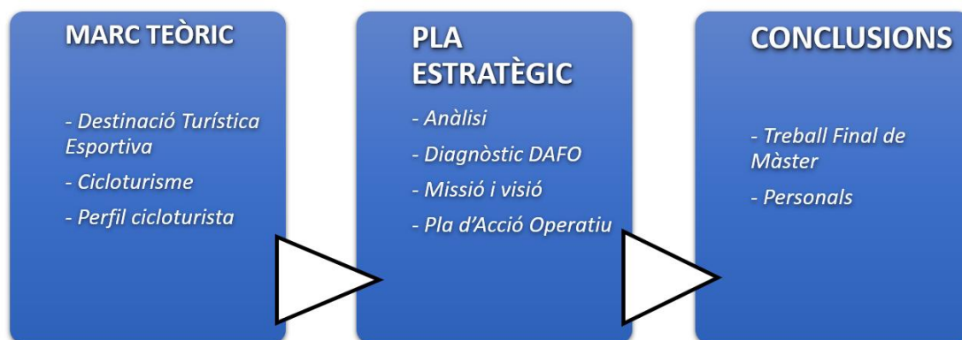
Gràfic 1: Estructura del treball

Per últim, es realitzen les conclusions del treball, per una banda, des del punt de vista del Pla Estratègic en si mateix i, per l'altra banda, des d'un punt de vista personal.